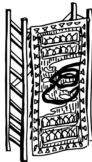
Regard volé entre deux briques , 2021 © Nine Hauchard

Nine Hauchard a également réalisé une édition imprimée en risographie puis sérigraphiée pensée comme une archive. Le petit ouvrage contient des reproductions de dessins réalisés dans les carnets lors des excursions une photographie prise à la vallée de jardins (Caen) dans laquelle enfants et éducatrices posent fièrement avec leur création.