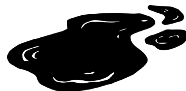
Les flaques , 2021 © Nine Hauchard