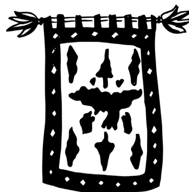
sous ma couette, je regarde le ciel , 2021 © Nine Hauchard