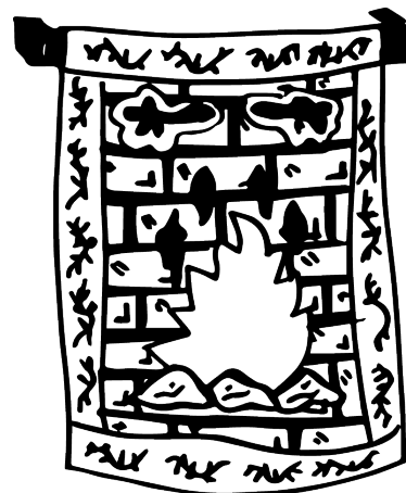
Le rêve du buisson bleu , 2021 © Nine Hauchard