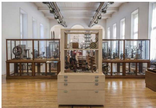
Vue de l'installation de Mathieu Mercier au Musée des Arts et Métiers.

Mathieu Mercier présente dans le Faitout une installation réalisée en 2018 dans le cadre de l'exposition « Monsieur Duchamp nous a dit que l'on pouvait jouer ici » au musée des Arts et Métiers de la Ville de Paris. Dans un meuble confectionné par ses soins, l'artiste réunit différents objets et documents d'époque relatifs à Marcel Duchamp, figure emblématique de l'art du XX e siècle. Toutes ces pièces sont issues de la propre collection de Mathieu Mercier et ont été utilisées par Duchamp dans ses œuvres, représentées dans Le Grand Verre (1915-1923) ou nommées dans ses notes.