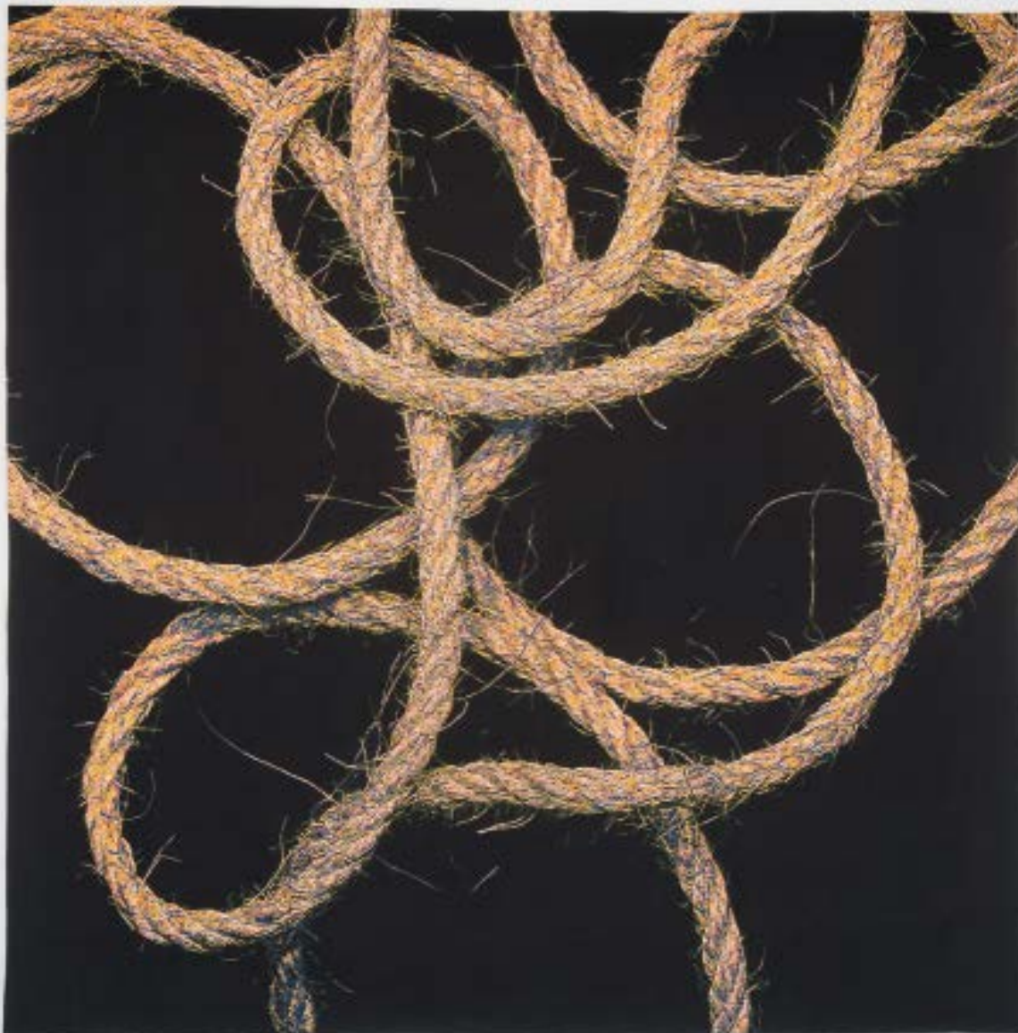
Mathieu Mercier, sans titre (2014) Laine, coton, fil synthétique. 328 x 314 cm. Collection Cité Internationale de la Tapisserie, Aubusson. Fonds Régional de Création de tapisseries contemporaines © Adagp, Paris, 2019.