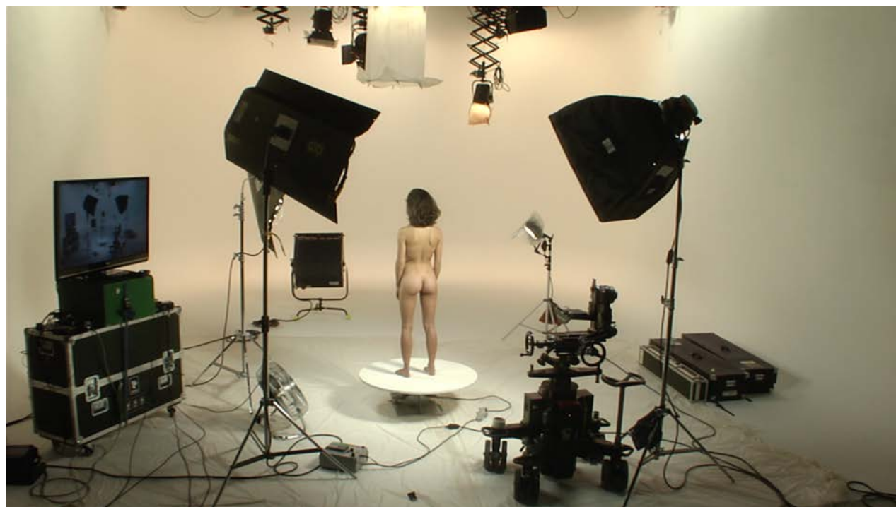
Mathieu Mercier, Le Nu (2013) Co-production Orange pour « pushyourart » 2013 au Palais de Tokyo. Video 3D, 4 mn 30