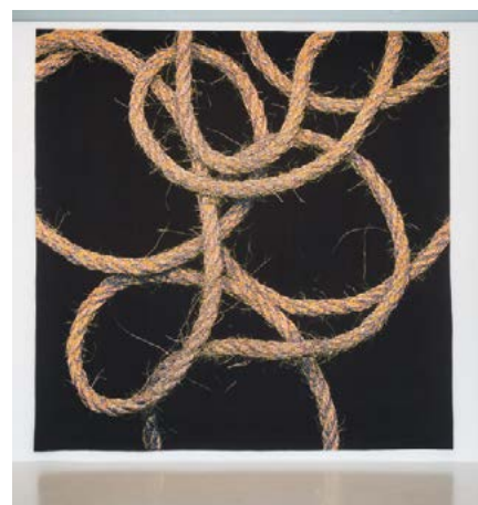
Mathieu Mercier, sans titre (2014) Collection cité internationale de la Tapisserie, Aubusson. Fonds Régional de création de tapisseries contemporaines © Adagp, Paris, 2019

Entre attraction pour le public et objet d'étude scientifique, un couple d'axolotls est présenté dans un dispositif de diorama conçu par l'artiste. En voie de