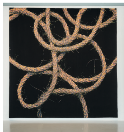
Mathieu Mercier, sans titre (2014) Collection Cité Internationale de la Tapisserie, Aubusson. Fonds Régional de création de tapisseries contemporaines © DR.

Entre attraction pour le public et objet d'étude scientifique, un couple d'axolotls est présenté dans un dispositif de diorama conçu par l'artiste. En voie de