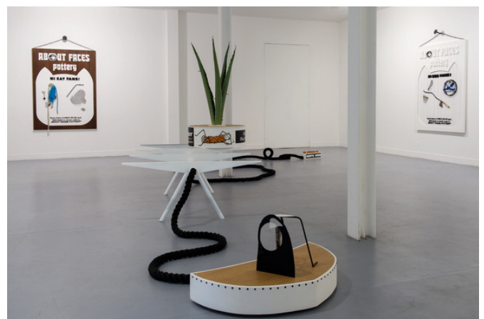
Fishbone (Diagram), 2014 / Collection Frac Normandie Caen

L'œuvre Fishbone (Diagram) mêle de nombreuses références. L'arête centrale reprend le design de la table « compas » de Jean Prouvé. Au sol d'un côté de l'arête, sur un socle qui fait office de tête de poisson repose un mobile qui évoque les œuvres du peintre et sculpteur américain, Alexandre Calder. À l'autre bout, une boîte posée au sol Hope Bar réinterprète le multiple réalisé par l'artiste américain Paul Mc Carthy « Nose Bar ». Le tout est relié par une corde noire épaisse comme signe graphique au sol évoquant tant la publicité que l'univers de la pêche.