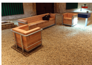
salon LC2 All-weather (après Le Corbusier), 2015 / Collection Frac Normandie Caen © Adagp, Paris, 2019