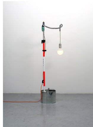
A lamp made by the artist for his wife (Fourteenth attempt), 2013 / Collection Frac Normandie Caen © Adagp, Paris, 2019