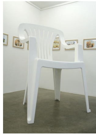
Chaise, 2008 / Collection Frac Normandie Caen © Lilian Bourgeat

» des années 50 à laquelle fait écho un pneu de vélo suspendu à une branche d'arbre et un hommage dans le titre à l'écrivain Matthew B Crawford qui sacrifia sa carrière universitaire au plaisir d'ouvrir un atelier de réparation de motos. Ainsi, différentes époques se superposent entre elles dans un collage loufoque flanqué des inévitables mégots de cigarettes.