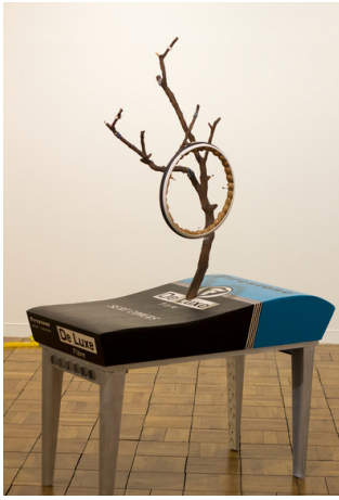
De Luxe (Coffin Matthew B. Crawford), 2014/ Collection Frac Normandie Caen © Gauthier Leroy

L'œuvre De Luxe (Coffin Matthew B Crawford) fait elle aussi référence à l'architecte Jean Prouvé en réinterprétant la table de réfectoire (1939). L'œuvre est accompagnée de diverses évocations du monde de l'automobile : la reproduction d'une boîte contenant des couvertures pour sièges de la marque « Firestone