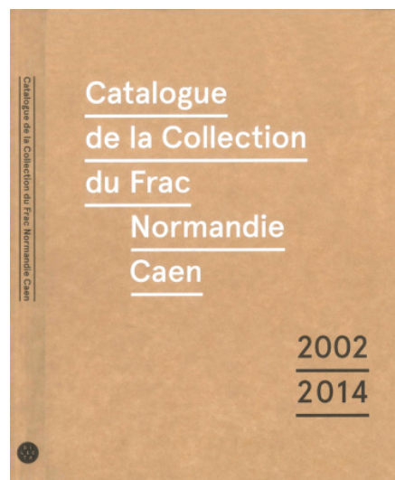
1 ère de couverture du catalogue

Le Frac fait son cinéma : invitation à Virginie Barré pour son film Le rêve géométrique