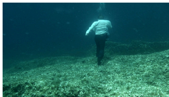
Simon Faithfull, Going Nowhere 2 (2011) / Collection Frac Normandie caen © Simon Faithfull