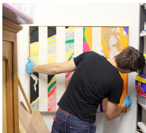
Installation de l'œuvre de Gilles Mahé, villeglé sur Buren (Hommage à Bertrand Lavier) (1998) / Collection Frac Normandie Caen, au Collège de Saint-Pierre-en-Auge en 2017