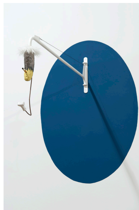
Gauthier Leroy, Smocking Corn & Bone , 2014

à 15h30 : visite de l'exposition un été indien