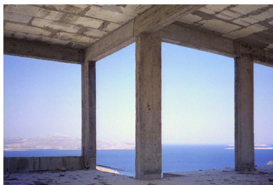
Véronique Joumard, Travelling , 2003 (détail) / collection Frac Normandie Caen © Adagg, Paris, 2020

Enfin, l'exposition évoque la mer et ses abords sous un angle plus poétique et décalé tout en maintenant comme fil conducteur cette idée de la construction et de l'usage détourné des matériaux industriels ou naturels.