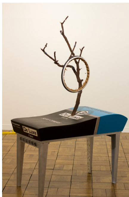
Gauthier Leroy, De Luxe (Coffin Matthew B. Crawford) , 2014 / Collection Frac Normandie Caen © Gauthier Leroy