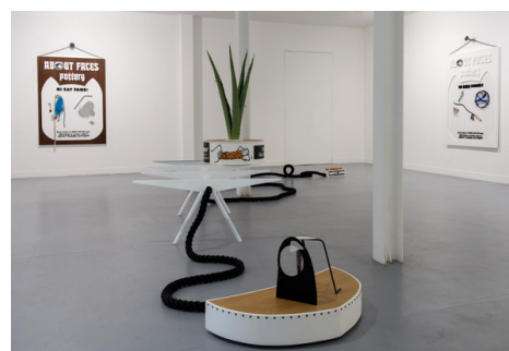
Gauthier Leroy, Fishbone (Diagram) , 2014 / Collection Frac Normandie Caen © Gauthier Leroy - photo : Marc Damage