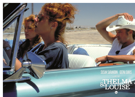
Extrait du film Thelma et Louise de Ridley Scott (1991)